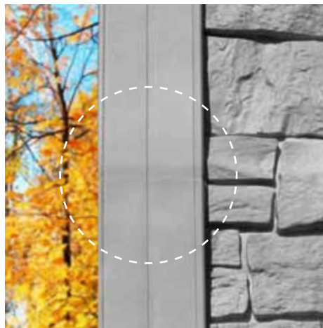
NoviTrim1 pour une finition dans le haut d'un pignon