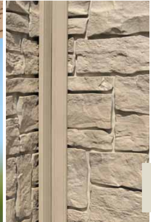
Finition double avec NoviTrim1 formant un coin intérieur sur 2 murs