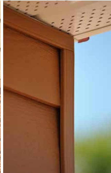
Finition avec NoviTrim1 pour coin extérieur et finition haut de mur