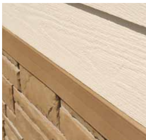
NoviTrim4 utilizado como moldura de transición alrededor de ventanas, puertas o esquinas