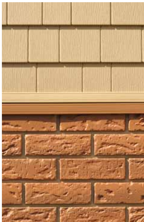
Transición entre dos revestimientos diferentes con NoviTrim1