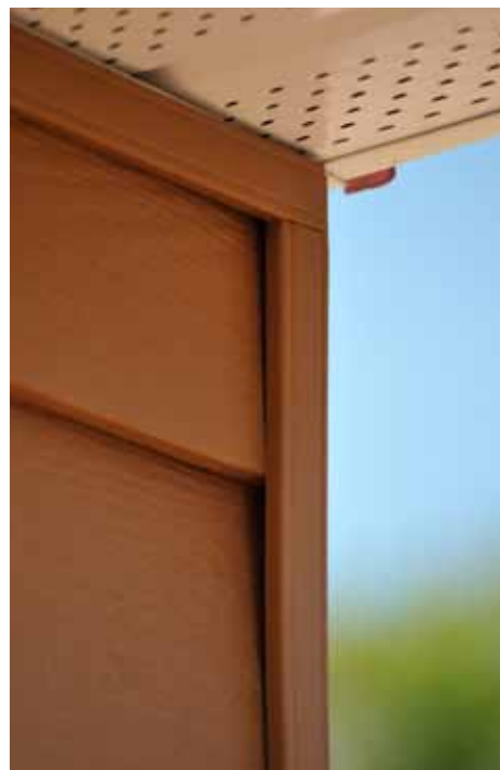
NoviTrim1 como terminación de plafón o en el borde de una pared