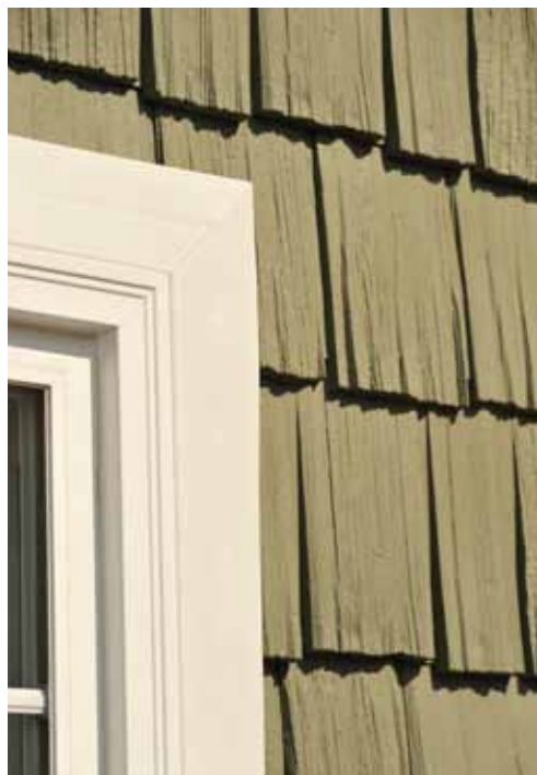
NoviTrim4 para marcos de ventanas

Moldura de polímero en dos piezas exclusiva de Novik®: NOVITRIM1™ y NOVITRIM4™