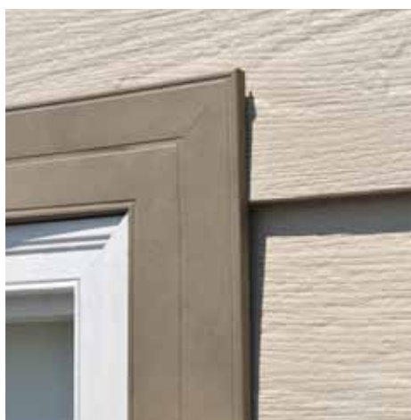
Unión entre dos molduras