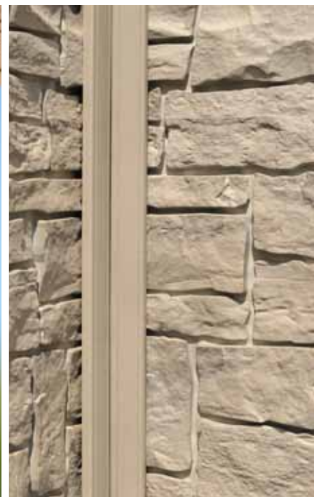
NoviTrim1 continuo para crear una esquina interna